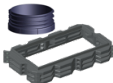
Rehausses pour trou d'homme.