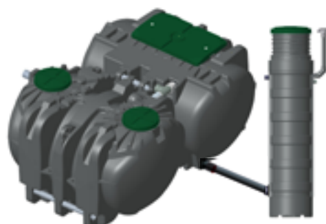
Poste de relevage